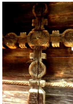
Foto 18: Detaliu. Funie răsucită de jur împrejurul bisericii Arhanghelii Mihail și Gavril , Rogoz, Țara Lăpușului, 2019.