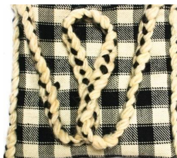
Foto 22: Detaliu. Funie răsucită, binaritatea alb-negru, Budești, Țara Maramureșului, 2019.