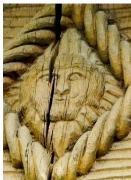
Foto 3: Simbol antropomorf inserat în romb, Hoteni – Țara Maramureșului, 2019.