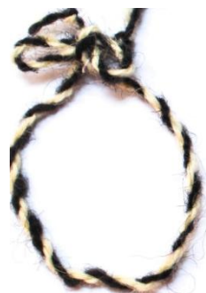
Foto 21: Funie răsucită, binaritatea alb-negru, Budești, Țara Maramureșului, 2019.