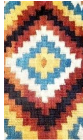
Foto 13: Detaliu pe șol/covor. Romb în trepte, Colecția Muzeului de Etnografie din Sighetu Marmației, Maramureșul Voievodal, 2019.