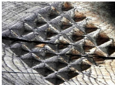
Foto 2: Romb cu fagure de miere , Bârsana, – Țara Maramureșului, 2019.