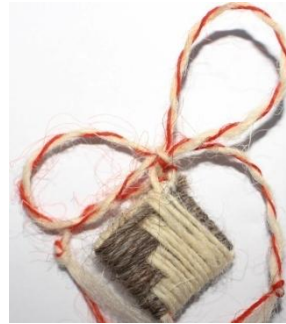
Foto 12: Mărțișor tradițional în formă de romb, Budești –Țara Maramureșului, 2019.