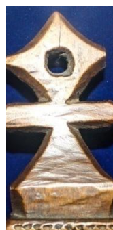
Foto 8: Romb stilizat pe pecetar antropomorf, Colecția Muzeului de Etnografie din Sighetu Marmăției, Maramureșul Voievodal, 2019.