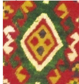
Foto 14: Detaliu pe șol/covor. Romb cu coarne Colecția Muzeului de Etnografie din de la Ieud, Maramureșul Voievodal, 2019.