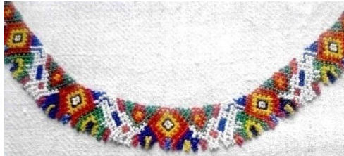
Foto 11: Romburi pe podoabă tradițională, Colecția Muzeului Județean de Etnografie și Artă Populară, Baia Mare, 2019.