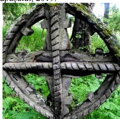
Foto 20: Detaliu. Torsada pe cruce celtică , Breb, Țara Maramureșului, 2019.