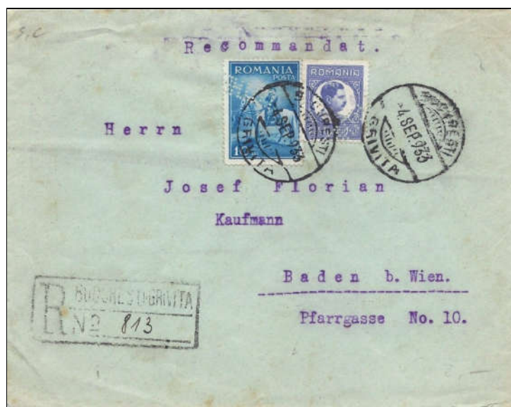
Figura 15 - Perforații neidentificate (încă)