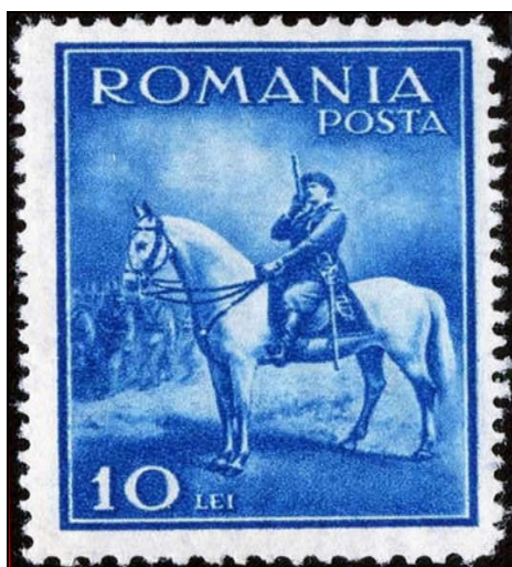
Figura 1 - Timbrul standard Carol II - călare, L.P. 97

Emisiunea filatelică Carol II – călare a fost pusă în circulație de către Poșta Română prin Direcțiunea Generală a Poștei, Telegrafului și Telecomunicațiilor (D.G.P.T.T.) în jurul datei de 8 iunie 1932, probabil cu prilejul aniversării a doi ani de la urcarea pe tron a regelui. Este compusă dintr-un singur timbru având valoarea nominală de 10 lei. Catalogele filatelice consultate 1 nu oferă nici o informație privind data exactă a punerii în circulație, singura mențiune fiind iunie 1932 .