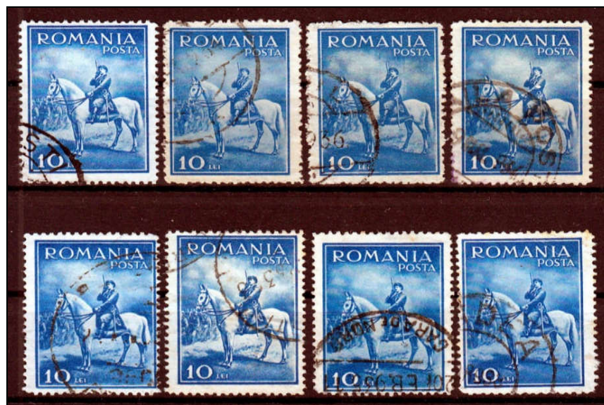
Figura 6 - Varietăți de hârtie, dantelură, încadrare și perforare

Tirajul emisiunii a fost unul de masă, necunoscut și nespecificat de nici o lucrare de specialitate consultată. Mai mult ca sigur s-a realizat în etape succesive, pe mai multe tipuri de hârtie existente la acea dată în tipografie, existând astfel mai multe varietăți de culoare și grosime ale hârtiei și apariția unor danteluri defectuoase, după cum se poate observa și din Eroare! Fără sursă de referință. Tot în această imagine putem observa și cadre deplasate ori perforații peste clișeul mărcilor.