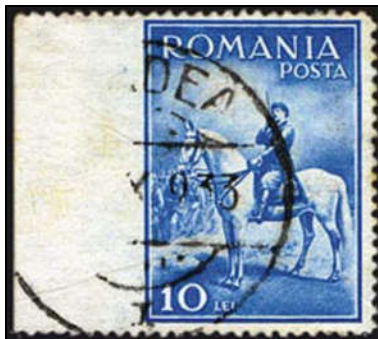
Figura 8 - Margine de coală nedantelată

O varietate frumoasă și spectaculoasă în același timp este marginea de coală nedantelată pe care o reproducem în Eroare! Fără sursă de referință . Existența ei este recunoscută de cataloagele de specialitate și cotate ca atare. Cauza apariției ei se datorează deplasării colii finite sau a încadrării greșite a acesteia în mașina de perforat, rezultând astfel neprelucrarea primului rând vertical. Teoretic, aceste coli ar fi trebuit reținute în tipografie și distruse.