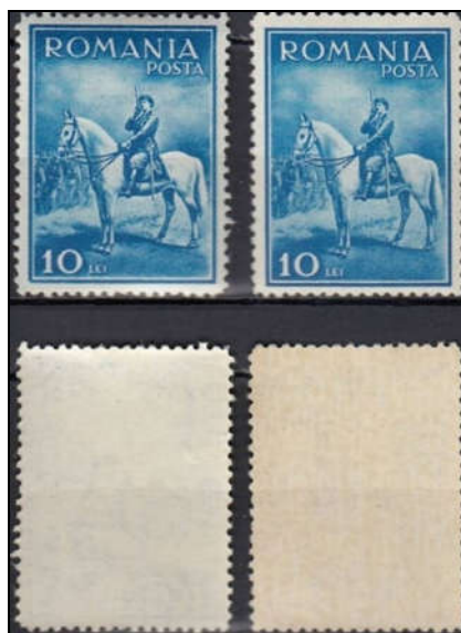
Figura 5 - Varietate de gumă albă și gălbuie

hârtiei în bobine achiziționată de Fabrica de timbre în anul 1931, „așa ca imprimarea timbrelor să se facă pe hârtie gumată în prealabil”[4]. Această procedură avea avantajul că rezolva problemele generate de mașinile Jagenberg, care erau încălzite cu gaz aerian, ce se foloseau înainte la gumarea colilor de timbre după imprimarea lor. Efectul nedorit se datora „temperaturii înalte la care erau supuse coalele după gumare, cerneala își pierde nuanța vie, iar coalele de hârtie se scorojeau așa că se produceau foarte multe maculaturi” [4]. Totuși, din analiza pieselor avute la dispoziție, tind să cred că doar pentru o parte din tiraj (probabil ultimele loturi) s-a folosit noua tehnologie, primele coli ale emisiunii fiind întâi tipărite și apoi gumate, întrucât noua instalație tocmai fusese pusă în funcțiune și a funcționat în parametri doar din toamna anului 1932. O mare parte din piesele analizate prezintă o hârtie subțire, gălbuie, cu gumă aproape inexistentă, fapt datorat, probabil, procedurii de spălare folosit la obținerea timbrelor respective.