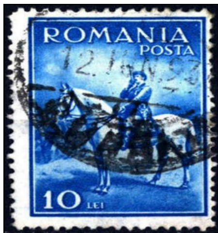
Figura 2 - Timbru cu data „timpurie”: 12 - IUN - 932

Emisiunea a avut putere de francare până pe data de 1 septembrie 1937, când a fost retrasă din circulație prin Ordinul D.G.P.T.T. nr. 143.347/1937.