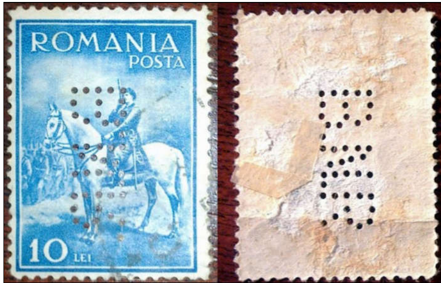
Figura 12 - Perforație BNR (față-verso)