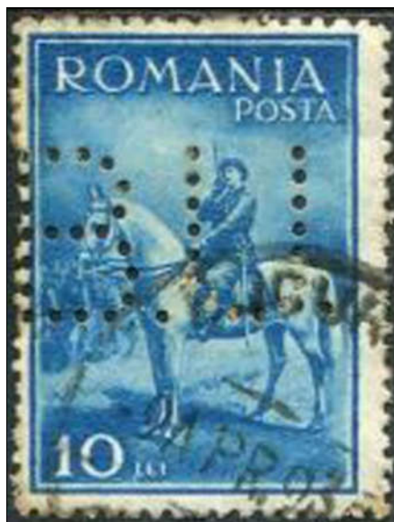
Figura 14 - Perforație BU

În timpul documentării am întâlnit și piesa din Eroare! Fără sursă de referință. , care ar merita studiată mai în amănunt de către colecționarii de timbre perforate. Perforația incompletă de pe cele două timbre cu care este francată recomandată 6 mi-a dat reale bătăi de cap în ceea ce privește identificarea societății care le-a executat. În finalul monogramei am putut să identific literele H, I și, probabil, A . Amintesc de această circulație în ideea că cineva poate va reuși să elucideze misterul. Dorind să aflu totuși ce este cu această perforație (care, trebuie să recunosc, mi-a stârnit curiozitatea prin simplul fapt că nu-mi era cunoscută), am întreprins o mică cercetare pornind de la înscrisurile existente pe corespondență. Pe fața plicului cuvântul cheie care mi-a atras atenția a fost Kaufmann , care tradus în limba română înseamnă comerciant . Până acum stăm în fața unei scrisori comerciale, adresată unui comerciant (de ce natură?) din Viena. Prima legătură: timbre perforate – comerciant, expeditorul este o societate comercială, dacă ar fi să respectăm definiția dată la începutul acestui capitol. Dar cine să fie expeditorul? Conform cercetătorului L. Erös alte două elemente de utilizare ale timbrelor perforate nu sunt îndeplinite: poziționarea monogramei pe timbru și aplicarea timbrului perforate pe un plic cu antetul societății. Să avem de a face un expeditor care a sustras aceste timbre? Probabil, și de