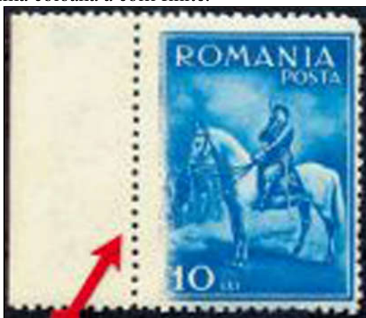
Figura 9 - Imprimare defectuoasă a mărcii

singura piesă cunoscută. Nu este exclus ca varietatea să se repete la toate piesele de pe prima coloană a colii finite.