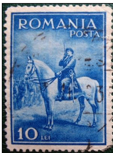
Figura 10 - Varietate fără alb

Piesa următoare prezintă o caracteristică aparte pe care cercetătorii au numit-o „varietate fără alb” ( Eroare! Fără sursă de referință. ).