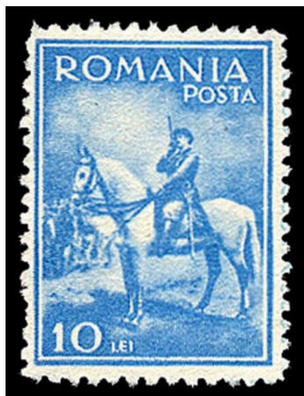
Figura 11 - Fals (tipar înalt)

Din categoria falsurilor face parte piesa semnalată de către Max Peter la începutul anului 2011 și reprodusă în Eroare! Fără sursă de referință. După cum se observă, caracteristicile acestei mărci sunt: procesul de imprimare „prin tipar înalt, cu ajutorul unui clișeu de zinc”, o hârtie „ceva mai groasă și fără filigranul CC, iar dantelura - grosolană, neregulată, diferită de 13½”[10]. Iată că nici măcar uzualele în serii nelimitate (să fie cât de multe că nu se știe niciodată) n-au scăpat de făcături.