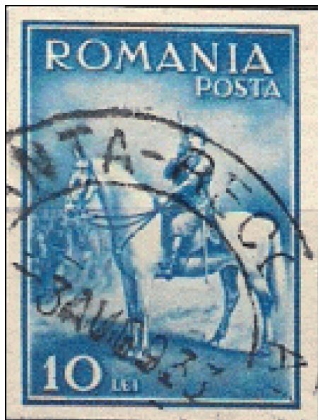
Figura 7 - Marca nedantelată - LA 97a [3]

O controversă ridicată pe forumurile de discuții o reprezintă existența pe piața filatelică a variantei nedantelate a acestei emisiuni. În Eroare! Fără sursă de referință. Eroare! Fără sursă de referință. am reprodus o asemenea marcă, circulată, purtând data expedierii 3-AUG-1933. Chiar dacă marca nedantelată este recunoscută de marile cataloage filatelice (LP 97a, Mi 436B) există voci care afirmă că această variantă ar fi de fapt o „făcătură” și că mărcile nedantelate sunt obținute în urma tunderii dantelurii. La o analiză comparativă între piesele prezentate în Eroare! Fără sursă de referință. și Eroare! Fără sursă de referință. se poate observa și cu ochiul liber că distanța de la cadrul mărcii și până la marginea timbrului este suficient de mare încât să combată această supoziție.